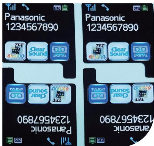
裕威為松下生產的產品

說，裕威的技術人員均擁有設計、制版、印刷20年以上的實戰經驗；同時，採用國際ISO9001:2015質量管理體系，通過了ISO14001:2015環境管理體系認證，得到美國UL認證(MH45399、LP3778)和加拿大CSA認證，擁有華夏鄧百氏全球唯一識別編碼(546355624)，並一直按照EICC體系管理自審。此外，裕威有着完整的系統管理、生產設備和誠信的品牌供貨商。