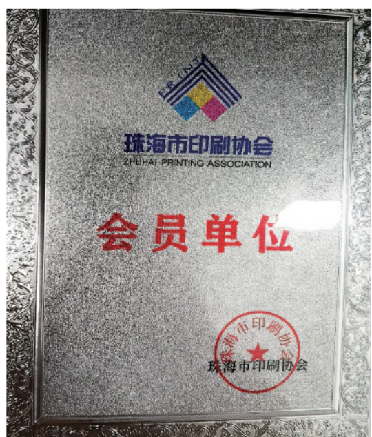
裕威是珠海市印刷協會會員單位